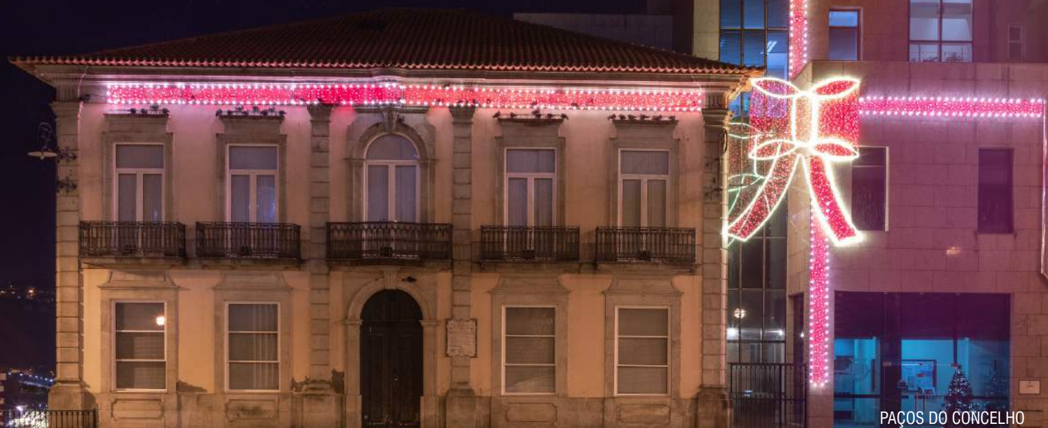
PAÇOS DO CONCELHO