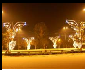
PRAÇA RENATO AGUIAR