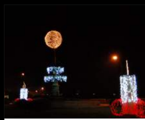
ROTUNDA BADEN POWELL