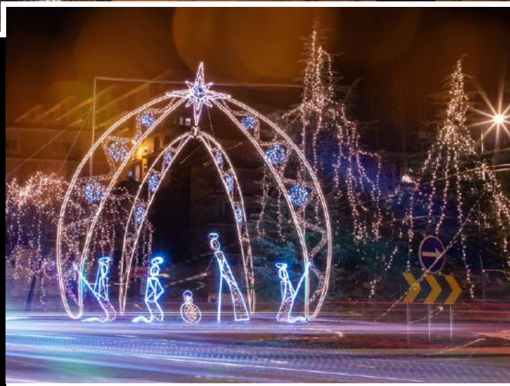
ROTUNDA DA PONTE