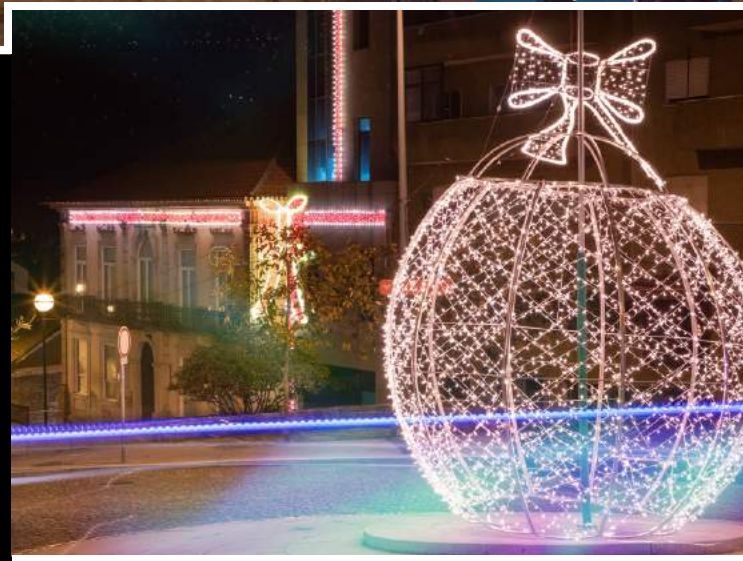
ROTUNDA CÂMARA MUNICIPAL