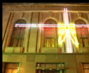
CASA DO DOURO