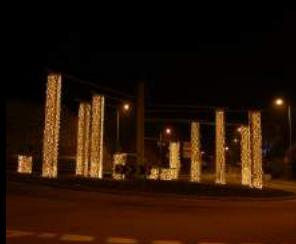
ROTUNDA DO CONCELHO