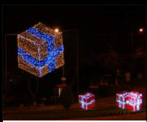
ROTUNDA DO HOSPITAL